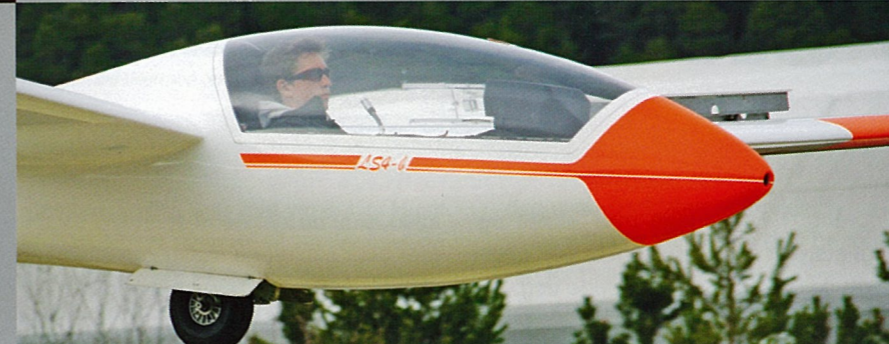
Forfatteren i dyp konsentrasjon under landing i LS-4.