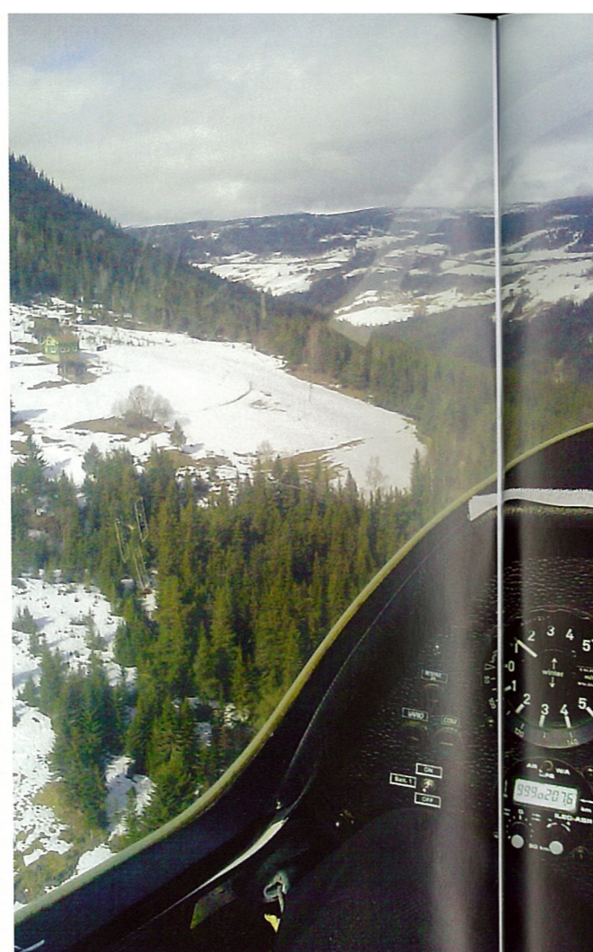
Vanlig utsikt under hangflyging.

ved å sende en elev for tidlig på enseter, og han så ingen grunn til å gjøre det igjen. Derimot skulle jeg få fly solo med ASK 21 som jeg da allerede hadde 12 soloturer med.