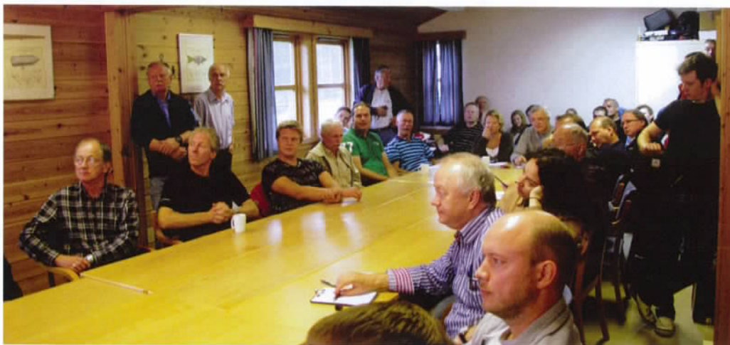
Fellesbriefing lørdag 0900

Det blir 2 motorlandinger: en "touch and go" ved avgang og landingen etter Nav-turen. Etter parkering blir det utfylling av log-sheet, pause med lunsj og deretter manuell utregning av egen nav-tur, svare på noen flyrelaterte og generelle spørsmål samt Aircraft Quiz fra siste års FLYNYTT. For at alle deltakere, nye som gamle, skal ha samme utstyr selger vi manuelle computere med fast TAS, korte linjaler i NM, digitale klokker og man får gratis minuttmerkepapir sponset av QBE.