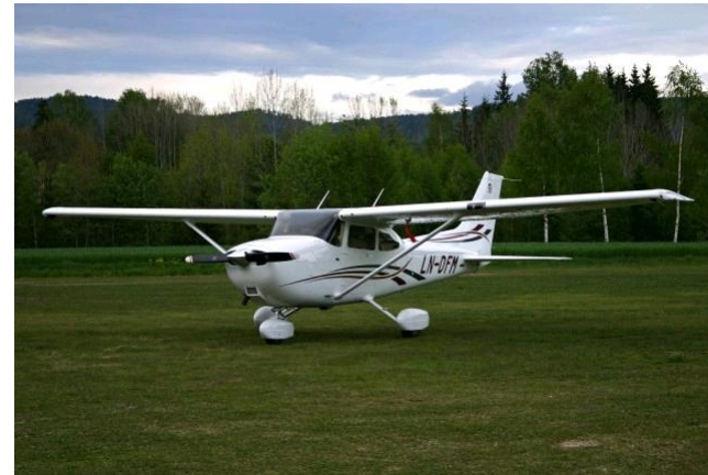
Kan også brukes til PPL-skoling