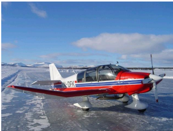
Primært sleping + turflying